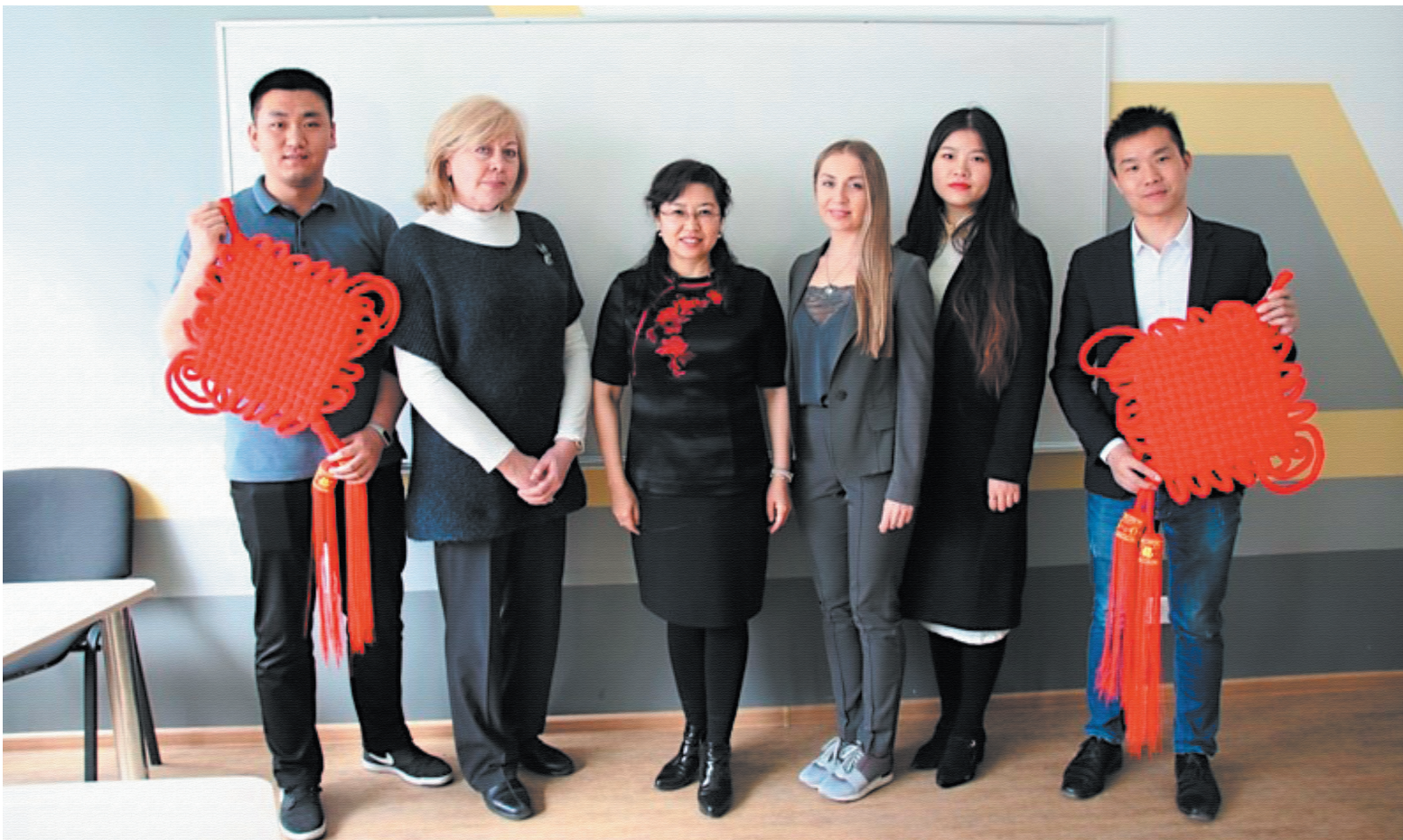
ТЕКСТ: АЛЕКСАНДРА ПУГАЧЁВА

Россия входит в шестёрку стран, наиболее привлекательных для иностранных студентов. В новосибирских вузах ежегодно увеличивается поток иностранцев – получать образование в Сибири им зачастую финансово выгоднее, чем на родине, и при этом наши дипломы котируются в их странах. Однако зарубежные студенты в чужой стране не всегда быстро адаптируются и привыкают к новым условиям. Университет экономики и управления (НГУЭУ) решил облегчить жизнь заграничным представителям, создав волонтерскую программу «Друг», поучаствовать в которой и помочь иностранцам может любой желающий. «Рост» узнал у руководителя и участников проекта, чем «Друг» помогает иностранным студентам и самим волонтерам.