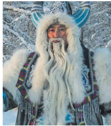
Чысхаан и Эхээ Дьыл (Якутия)

Носит удмуртский Бабай фиолетовую шубу, в руках у него — кривой от долгих странствий по миру посох. Подарки детям он хранит не в мешке, а в берестяном коробе.