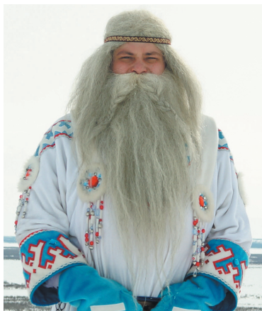
Ямал Ири (Ямало-Ненецкий АО)

Живёт бурятский Дед Мороз в Улан-Удэ. На территории этнографического музея народов Забайкалья есть юрта Белого Старца. Вы узнаете его сразу: он ходит в белой одежде, носит длинную белую бороду, в одной руке у него чётки, в другой — посох с изображением мифического водяного чудовища.