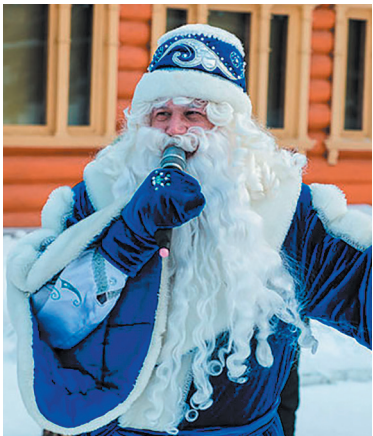
Кыш Бабай (Татарстан, Башкирия)

ТЕКСТ: МАРГАРИТА КНЯЗЕВА