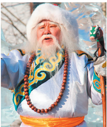
Сагаан Убгэн (Бурятия)

Уже одиннадцать лет Кыш Бабай живёт в своей резиденции в татарском селе Яна Кырлай со своей дочерью Кар Кызы (по-нашему Снегурочка). Он носит синий кафтан и мохнатую тубетейку. Увы, не каждый житель России может поговорить с Кыш Бабаем — он говорит только на татарском языке.