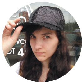
ВИОЛЕТТА, 22 ГОДА

ТЕКСТ: АНДРЕЙ СТРЕЛЕЦ ИЛЛЮСТРАЦИИ: АННА ДУМЧЕНКО