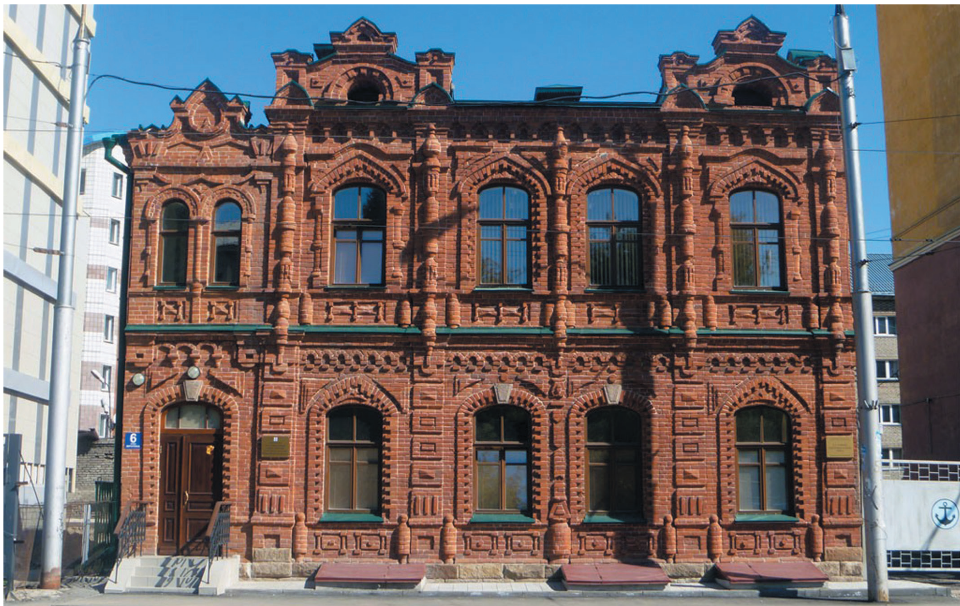
→ Особняк томского купца на ул. Мичурина, 6. Современный вид

Хэллоуин – это ночь перед Днём Всех Святых. Говорят, Хэллоуину не менее двух тысяч лет – праздник берёт истоки из кельтской культуры. По легенде, в ночь с 31 октября на 1 ноября мир живых и мёртвых сливается в единое целое, и усопшие разгуливают по улицам города. А каких призраков скрывает Новосибирск и какими загадочными историями успел обзавестись наш город за 123 года – в преддверии Хэллоуина расскажет газета «Рост».