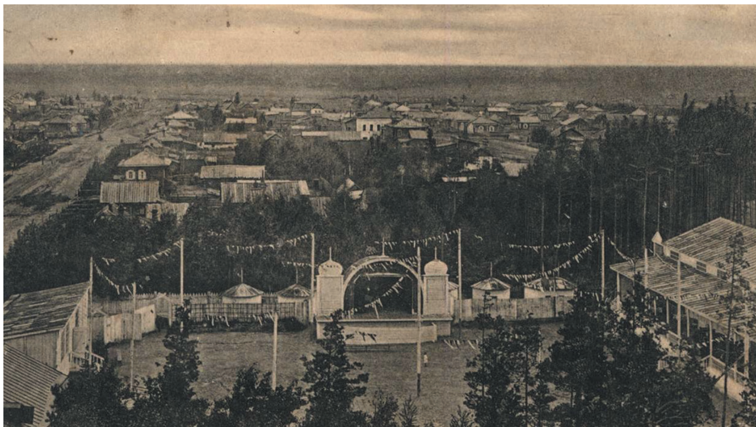
→ Сад "Альгамбра" в Новониколаевске. Фото 1910-х годов