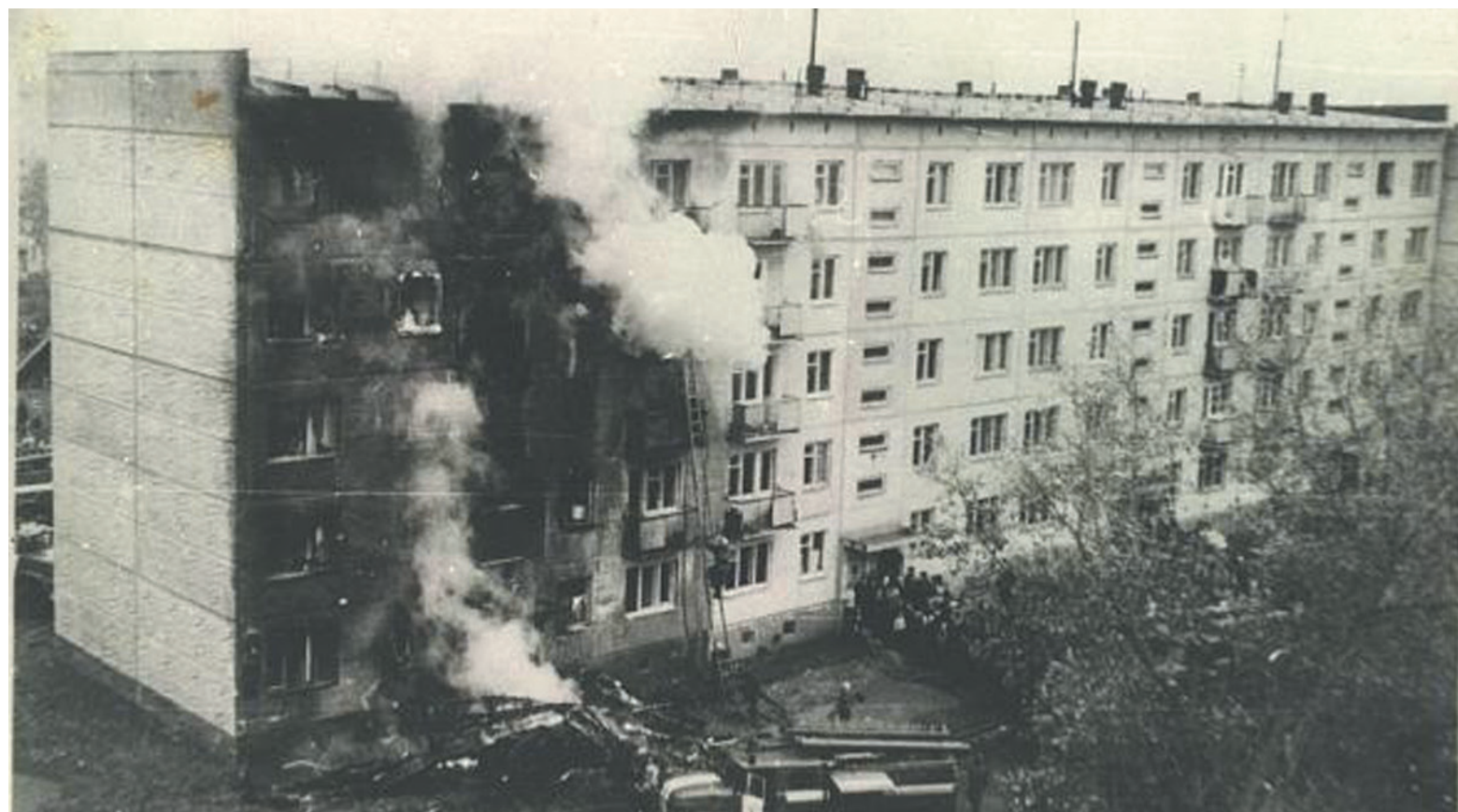
→ Дом на ул. Степная, 43/1 после падения самолёта. Фото 1976 года