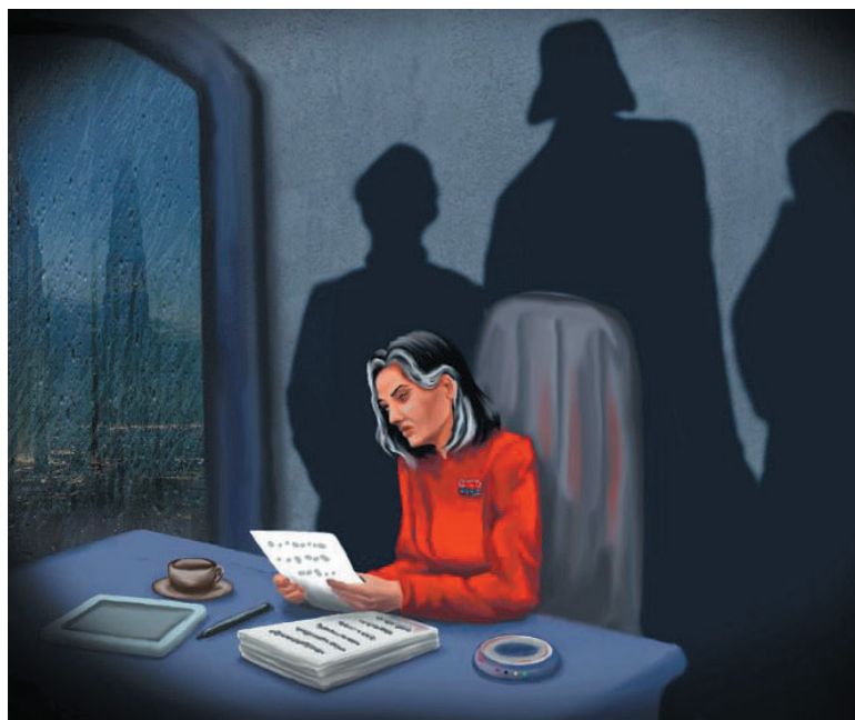
→Художница с ником Мартиша иллюстрирует фанфики по «Звёздным войнам»

Наверняка у каждого из нас есть любимое произведение, персонажи которого прочно засели в голове. Фантазия безумствует, когда начинаешь думать: а как же дальше у них всё сложилось? Ответа не находишь – произведение-то закончено. Именно поэтому десятки тысяч людей сами продолжают творить судьбы любимых героев из книг, аниме или сериалов. Такое творчество называется фанфикшен. В народе просто «фанфик». Корреспондент «Роста» попробовал поближе познакомиться с этим явлением.