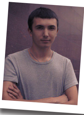
Солнце русской библиотеки

Огромные высокие полки. На каждой из них сотни жизней и историй – выдуманных и реальных – все они переплетены, сшиты. Некоторые даже переизданы и дополнены. Книги. Они бывают новые и «старые». Новые пахнут типографской краской, у них острые листы, о которые с лёгкостью можно поранить пальцы. «Старые» же пахнут залежавшейся бумагой, а их пожелтевшие страницы мягкие и рыхлые на ощупь. Новые книги со временем становятся «старыми». Книги отправляются на полку вечности. И вот уже тянутся к цветным корешкам твои дети, а потом и внуки. Так создаются библиотеки. Домашние, школьные, городские, областные.