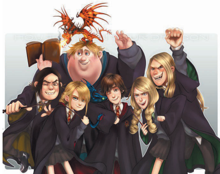
→Кроссовер по мультфильму «Как приручить дракона», где герои оказались во вселенной Гарри Поттера

Такое творчество живёт благодаря фантазии, а значит, будет жить ещё очень долго, потому что никто и ничто не сможет заставить нас перестать мечтать и фантазировать!